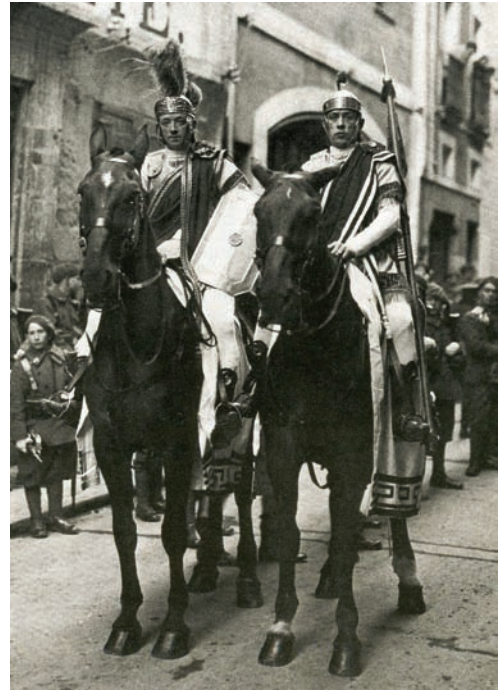
Soldados romanos en la década 1930