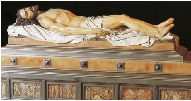
Paso del Santo Sepulcro. Agapito Vallmitjana. 1887