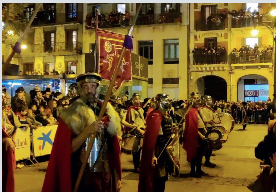
La banda junto a la guardia pretoriana en la cabalgata de reyes.

Hacían falta alumnos. Muchos hermanos, a través de sus contactos y redes sociales, trabajaron invitando a pertenecer a la banda que pretendíamos crear. Hubo una buena respuesta a la invitación. Teníamos ya profesores y alumnos, hacían falta instrumentos. Sólo quedaban en la sede unos pocos tambores de la antigua banda, teníamos que comprar y que la compra encajara en los presupuestos. Este reto todavía era más difícil. Pero nuevamente, la providencia nos allanó el camino. Encontramos por walapop, en Cataluña, una cofradía que cambiaba toda su banda de tambores y allí nos fuimos a verlos. Los tambo-