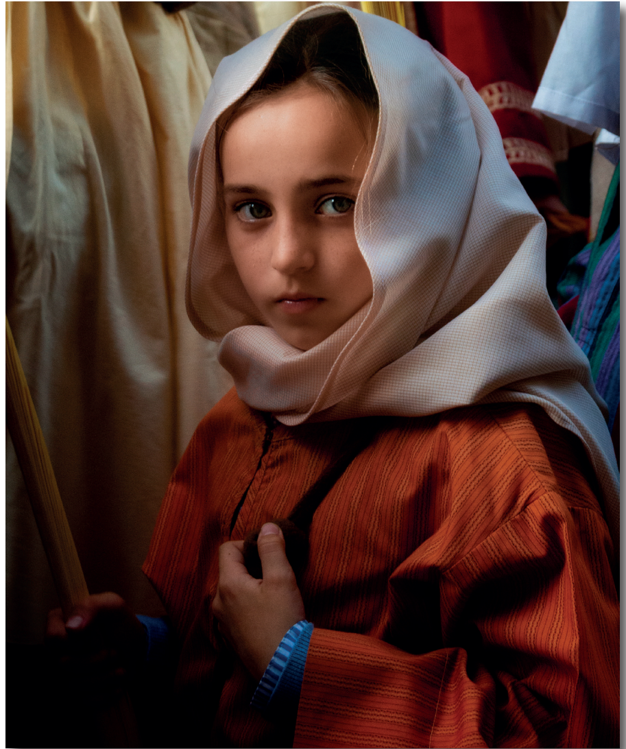
Premio fotográfico "La Pasión del Señor", 2022. Título: Ángel en Viernes Santo. Autor Faustino Tardío.