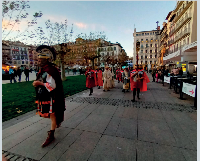
La guardia pretoriana escolta al paje real camino del Casino Eslava.