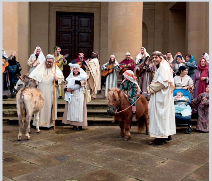
Un nutrido grupo de Pastoral Familiar hizo uso de la ropa de la Hermandad.