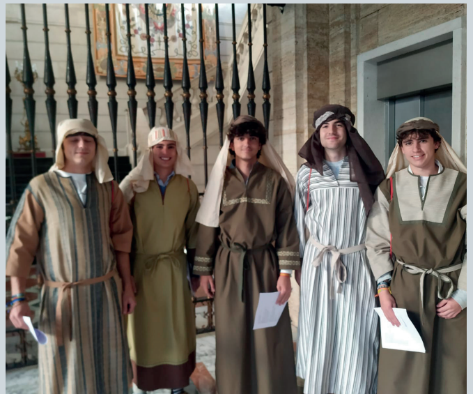
La Universidad de Navarra también aprovechó nuestros trajes.