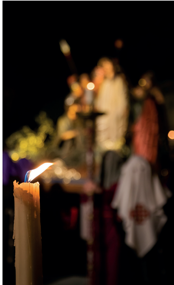
Lux in tenebris. Autor: Jaime Latorre Hurtado.

Hoy y aquí quiero explicar qué he sentido cuando durante años he participado en las procesiones como simple hermano de vela, como uno de los cientos que forman dos filas a ambos lados de los pasos. Revestirse de un hábito negro y cubrir el rostro con una caperuza morada es, en primer lugar, una renuncia a nuestra apariencia, a nuestra imagen pública. Entendemos que nosotros no somos importantes. Lo importante es atraer las miradas de quienes contemplan la procesión hacia los pasos y centrarlas en lo que representan: la pasión, muerte y resurrección de Cristo. Nos ocultamos para que la vista se dirija a lo que es importante. Nos hacemos a un lado, nos difuminamos, para que