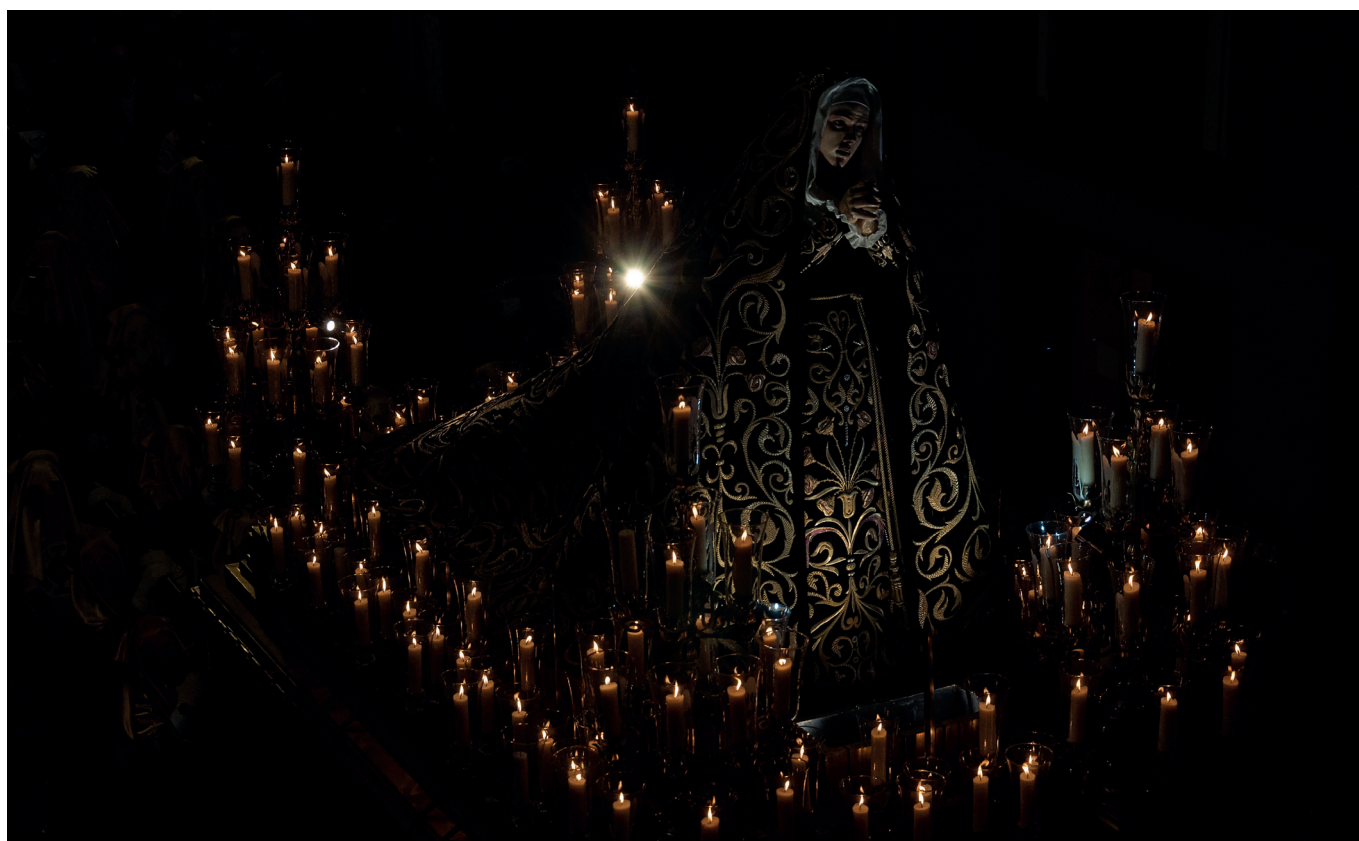
“Traslado 2022” Autor: Miguel Ángel Breto.

La Hermandad de la Pasión del Señor ha creado un nuevo grupo simbólico, el de “Los Siete Dolores”.