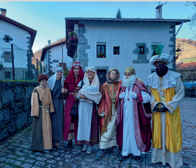
Con la Asociación Chopical de Leiza.