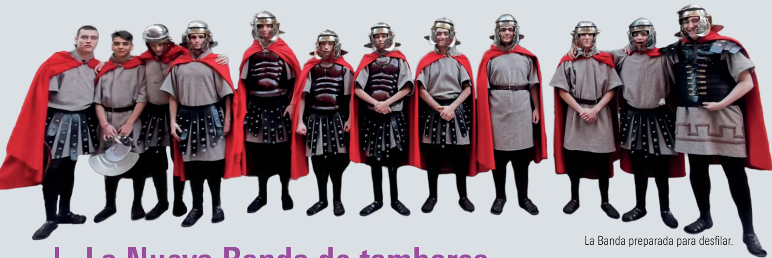
La Banda preparada para desfilarse.