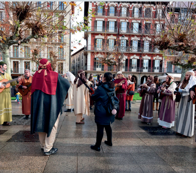
Pastoral Familiar amenizando con nuestros trajes.