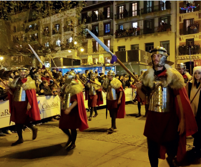
La nueva banda de tambores y la guardia pretoriana en la Cabalgata de Reyes.