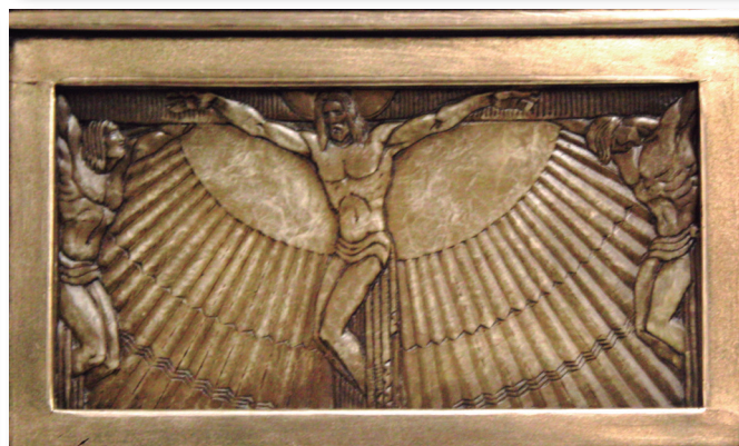
Bajorrelieves de Ramón Arcaya en las andas del paso (1926).

en abundancia. Él resucitará y gracias a su victoria sobre la muerte serán bienaventurados los pobres de espíritu, porque de ellos será el Reino de los Cielos; serán bienaventurados los que lloran, porque ellos serán consolados; serán bienaventurados los que sufren, porque ellos heredarán la tierra; serán bienaventurados los que tienen hambre y sed de justicia, porque ellos quedarán saciados; serán bienaventurados los misericordiosos, porque ellos alcanzarán misericordia; serán bienaventurados los limpios de corazón, porque ellos verán a Dios; serán bienaventurados los que trabajan por la paz, porque ellos se llamarán hijos de Dios; y serán bienaventurados los perseguidos por causa de la justicia, porque de ellos es el Reino de los Cielos.