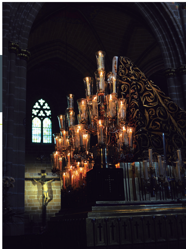
Fotografía de Silvia Ollo Casas, "Madre e hijo".

Por ello la Hermandad ha creído conveniente que sean religiosos quienes acompañen a nuestros Obispos en la predicación del Septenario de la Soledad.