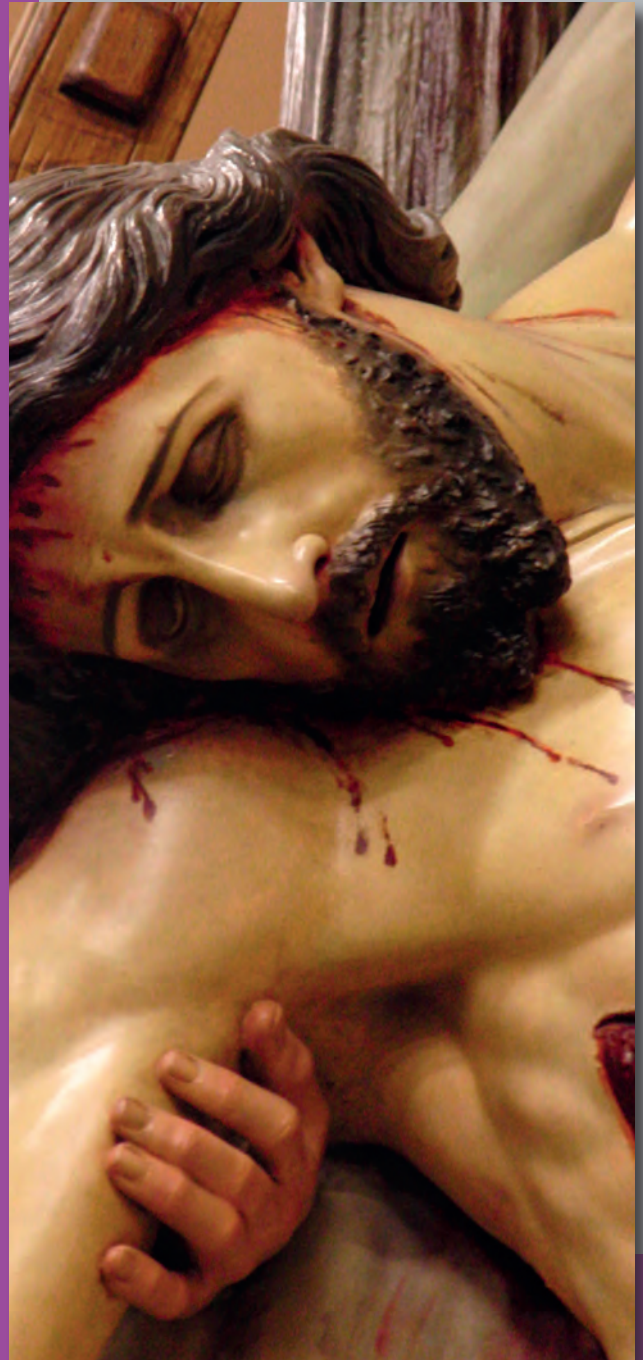
Detalle del cuerpo inerte de Cristo

Porque, recordemos, había una escalera por la que Dios bajaba todos los días para caminar y conversar con Adán y Eva en el jardín del Edén. Sin esa escalera por la que Dios bajaba a ellos, todos los sueños del hombre son estériles. Conocemos la historia de otra escalera, la de Jacob, que llegaba hasta el cielo y por ella bajaban y subían los ángeles. Al final de la escalera estaba Dios. Pero, cuando Dios quiso que su amor por nosotros se hiciera palpable y visible, cuando Dios quiso bajar de nuevo para estar con nosotros, nos envió una escalera que une cielo y tierra, ésta se llama Jesús: