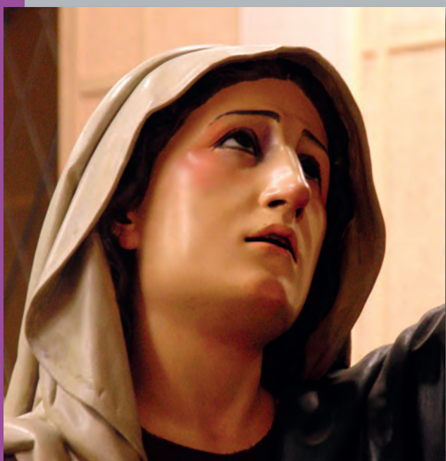
La Virgen contempla el descendimiento