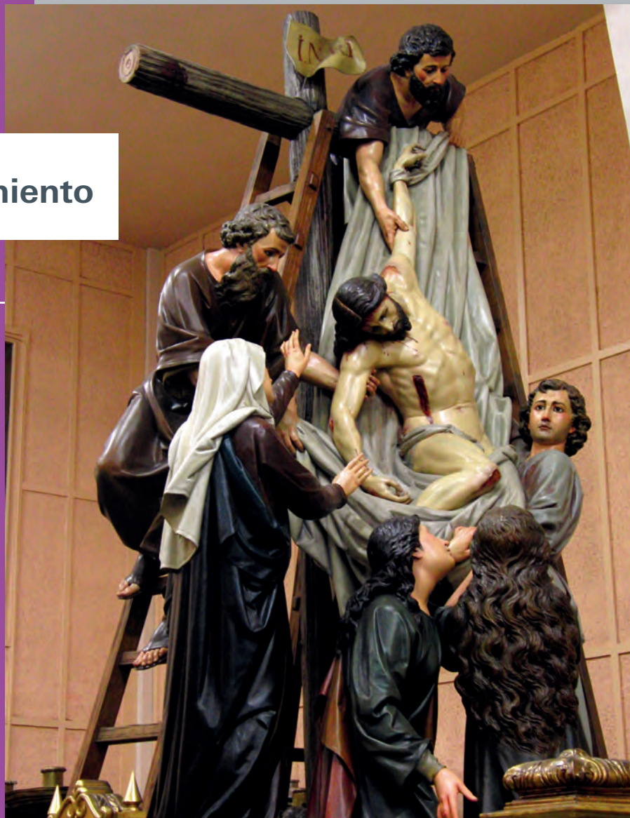
Conjunto escultórico del paso del Descendimiento