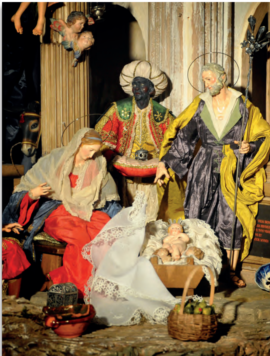
Belén napolitano (Colección particular, Pamplona)