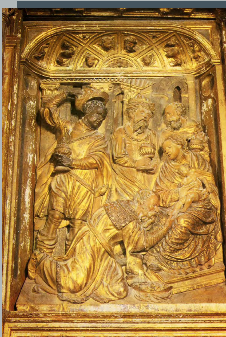
Epifanía o adoración de los Reyes. Retablo de Armañanzas, atribuido a Andrés de Araoz y taller (ca. 1560)

Niño, sentimos cerca de los Magos, como sabios compañeros de camino. Nos enseñan a no contentarnos con una vida mediocre, sino a dejarnos siempre fascinar siempre por la bondad, la verdad, la belleza... Y nos enseñan a no dejarnos engañar por las apariencias... Tenemos que ir más allá, más allá de la mundanidad, más allá de la oscuridad... Ir hacia Belén, allí donde en la sencillez resplandece el Sol que nace de lo alto, el Rey del universo. A ejemplo de los Magos, con nuestras pequeñas luces busquemos la luz. Así sea.