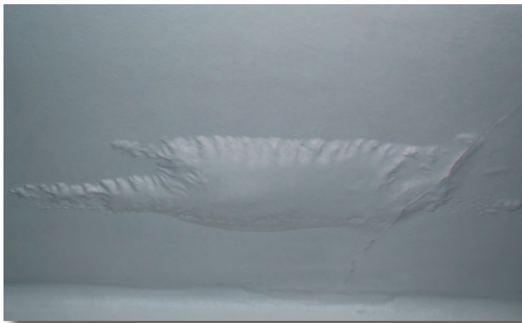
Cañerías con problemas