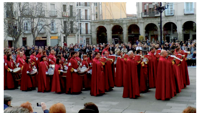
Como el año pasado, la banda de la Cofradía de la Flagelación de Logroño participará en la procesión y acto de oración