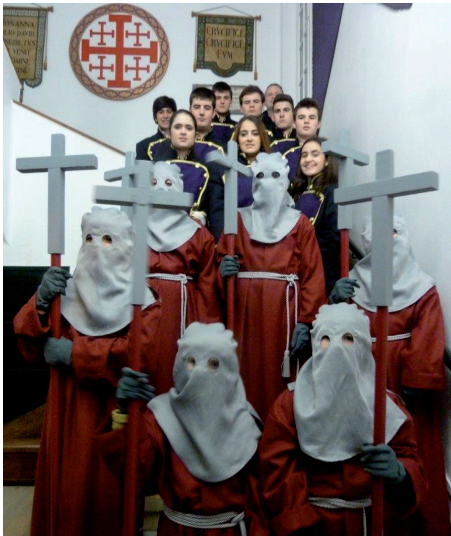
Los jóvenes de la Guardia de Honor y los Mozorritos antes de salir el pasado Miércoles de Ceniza

Debido a los cambios organizativos que se han producido dentro del área de Vestuario, pedimos a todos los figurantes que pongan especial atención a las indicaciones que a sobre la hora de presentación en Vestuario, etc. se les darán al realizar la inscripción y que también figurarán en las tarjetas que se entregan para el acceso a la Hermandad los días de Procesión.