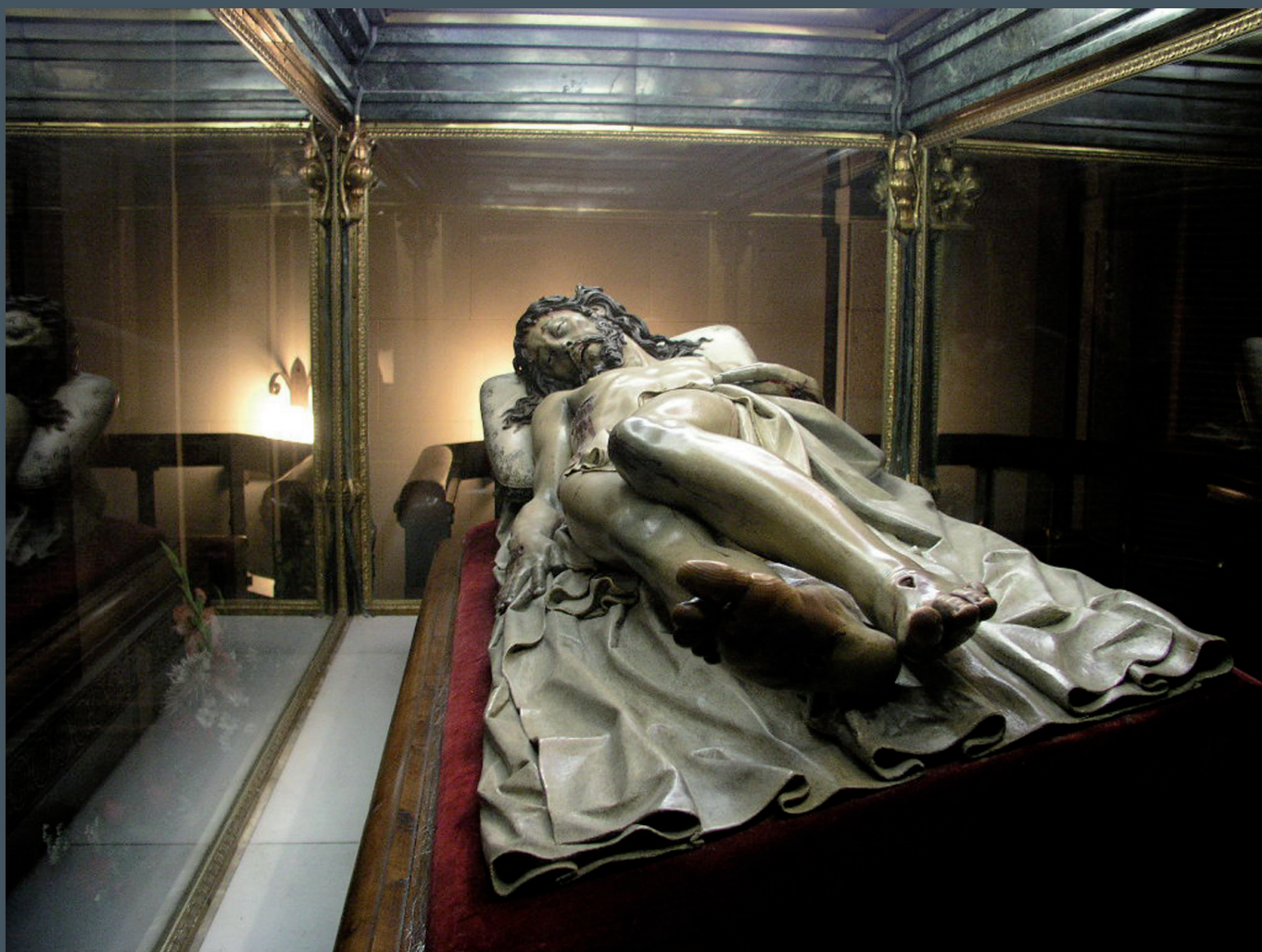
Gregorio Fernández, "Santo Cristo" del Convento de Capuchinos de El Pardo

El Cristo yacente fue, dentro de la escultura barroca castellana, uno de los exponentes más significativos, motivo de veneración de los fieles y uno de los protagonistas en los pasos procesionales de Semana Santa.