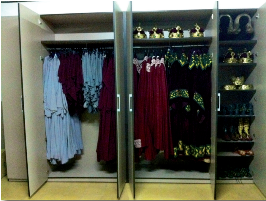
Interior de uno de los nuevos armarios: Hachones, Magnates del Sepulcro, Siete Palabras y sus accesorios.