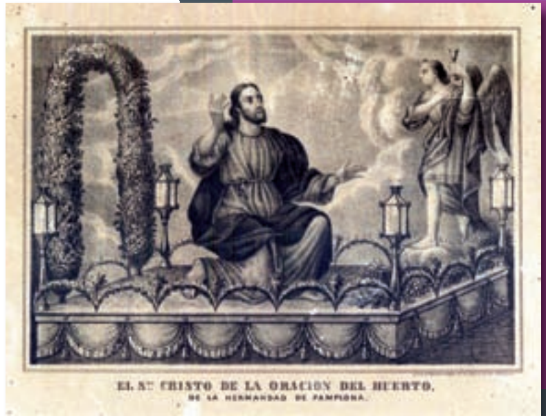
Litografía del antiguo paso de la Oración en el Huerto

Sea bienvenido el antiguo Cristo de la Oración en el Huerto de vuelta a su casa, en la que, cuando pueda realizarse la conveniente y necesaria restauración, volverá a recibir el culto que recibió en el pasado.