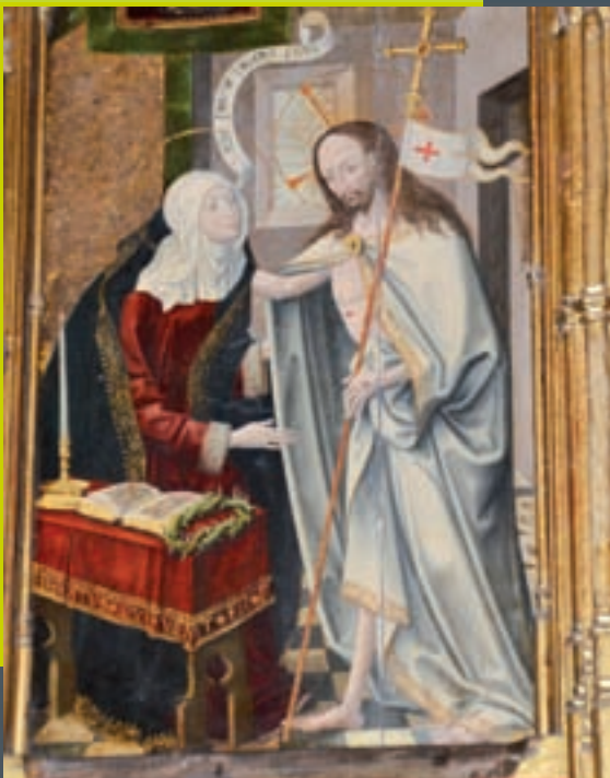
Cristo resucitado se aparece a su madre la Virgen María. Retablo de Caparros en la Catedral de Pamplona.

La fe de los discípulos nació en los primeros encuentros con Jesús. Le proclaman “Mesías, Hijo de Dios, rey de Israel”, y se mantienen fieles cuando “muchos de sus discípulos se volvieron atrás y ya no andaban con él”.