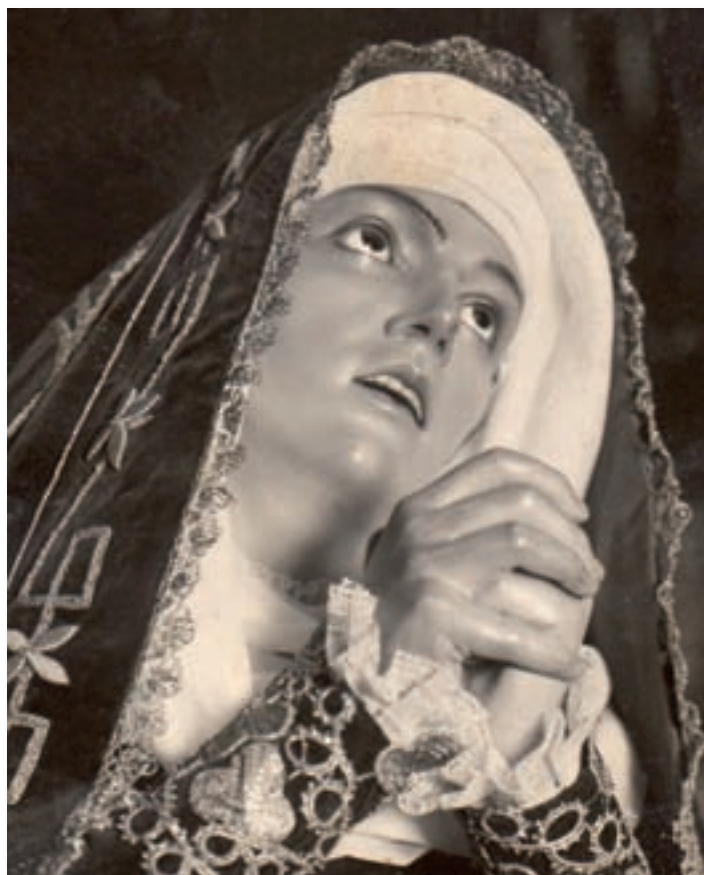
Virgen de la Soledad de Pamplona