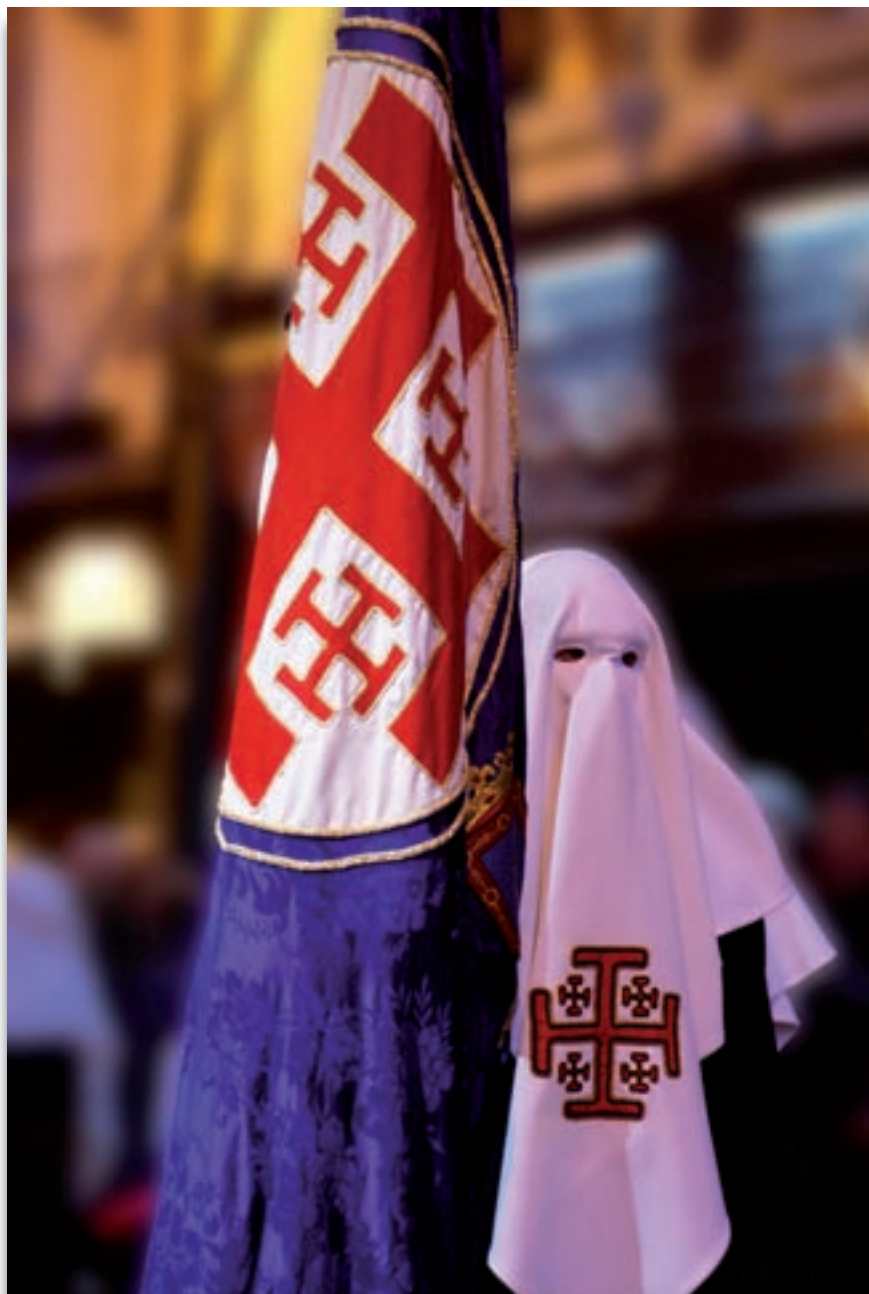
Silvia Olló Casas "La Hermandad" · Premio fotográfico "La Pasión del Señor" 2012