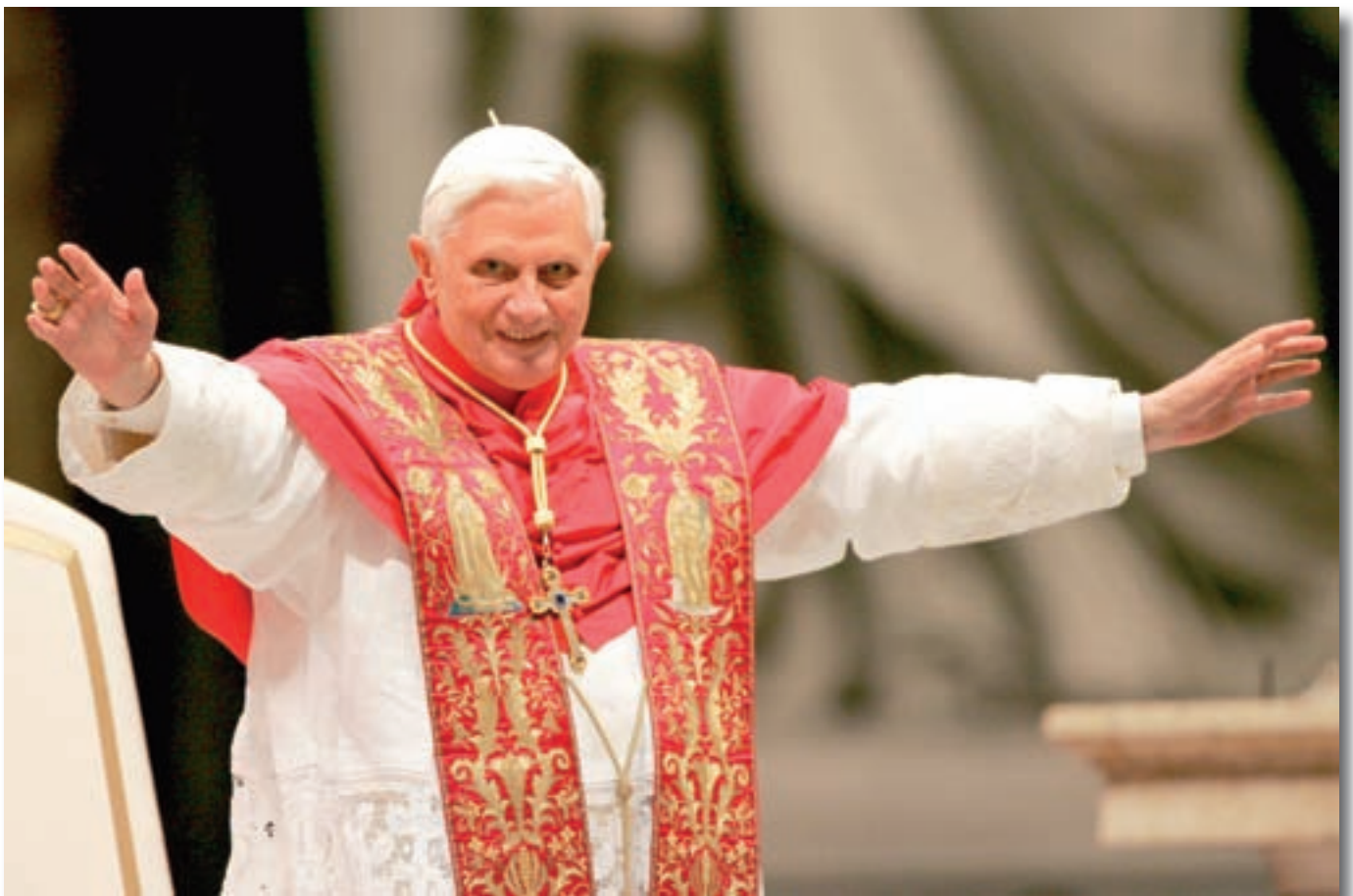
Su Santidad Benedicto XVI, Papa hasta el 28 de febrero de 2013

La Hermandad de la Pasión del Señor de Pamplona, a la vez que rinde un último homenaje de fidelidad y afecto hacia quien durante casi ocho años ha sido el Vicario de Cristo en la Tierra, quiere agradecerle todos sus desvelos en el gobierno de la Iglesia Católica y, muy especialmente, su vigoroso y claro magisterio, con el que nos ha iluminado y sostenido en la fe, la esperanza y la caridad. Para ello, recoge con cariño un fragmento de ese magisterio relacionado con la Pasión de Cristo, las palabras que pronunció Benedicto XVI al concluir el Vía Crucis celebrado en Madrid el 19 de agosto de 2011, durante la Jornada Mundial de la Juventud: