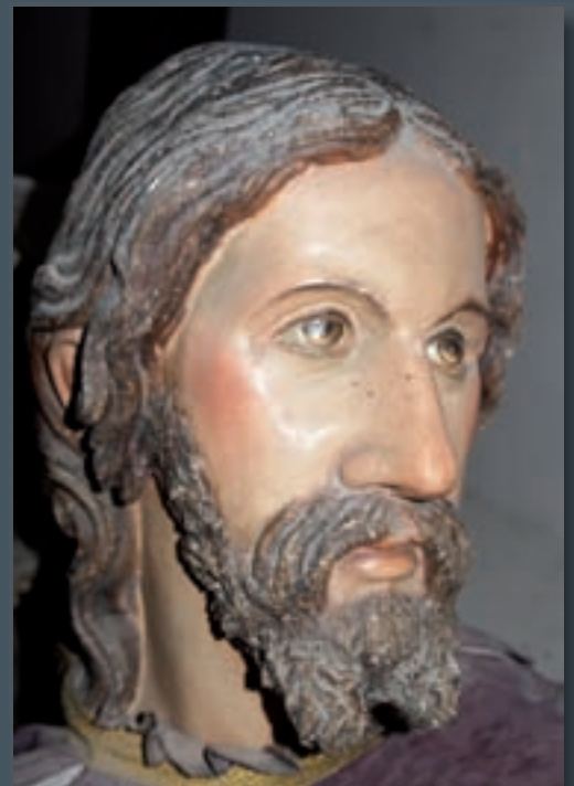
Cabeza de Cristo, obra de Antonio Esteve