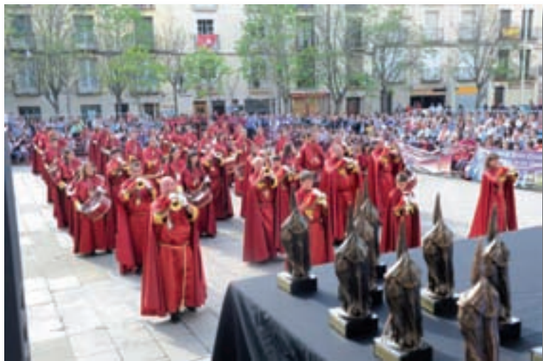
Banda de la Cofradía de la Flagelación de Logroño