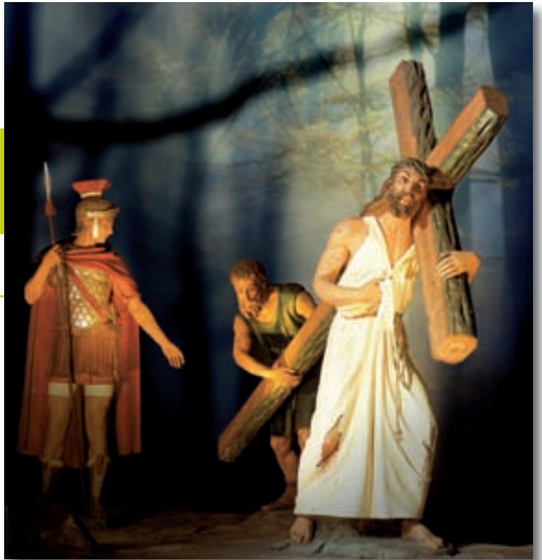
Paso de la Cruz a Cuestas

Nosotros seguimos a corta distancia el paso del Señor, lento. Ni una sola queja: Va cargado con nuestros pecados, nuestros abandonos, nuestras traiciones y olvidos; carga con la ingratitud de la humanidad, que no ha reconocido el sacrificio que hace Jesús para salvarnos. A pesar de ello, cada paso es un paso de amor y de perdón. Jesús pide al Padre que no nos tenga en cuenta nada de lo pasado. Vemos a Jesús y allí presentes lloramos lágrimas, por el castigo dado a un Hombre que pasó haciendo el bien, sanando, y