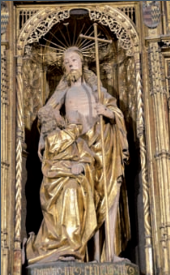
Santo Tomás introduce su mano en el costado de Cristo. Retablo de Caparros en la Catedral de Pamplona.