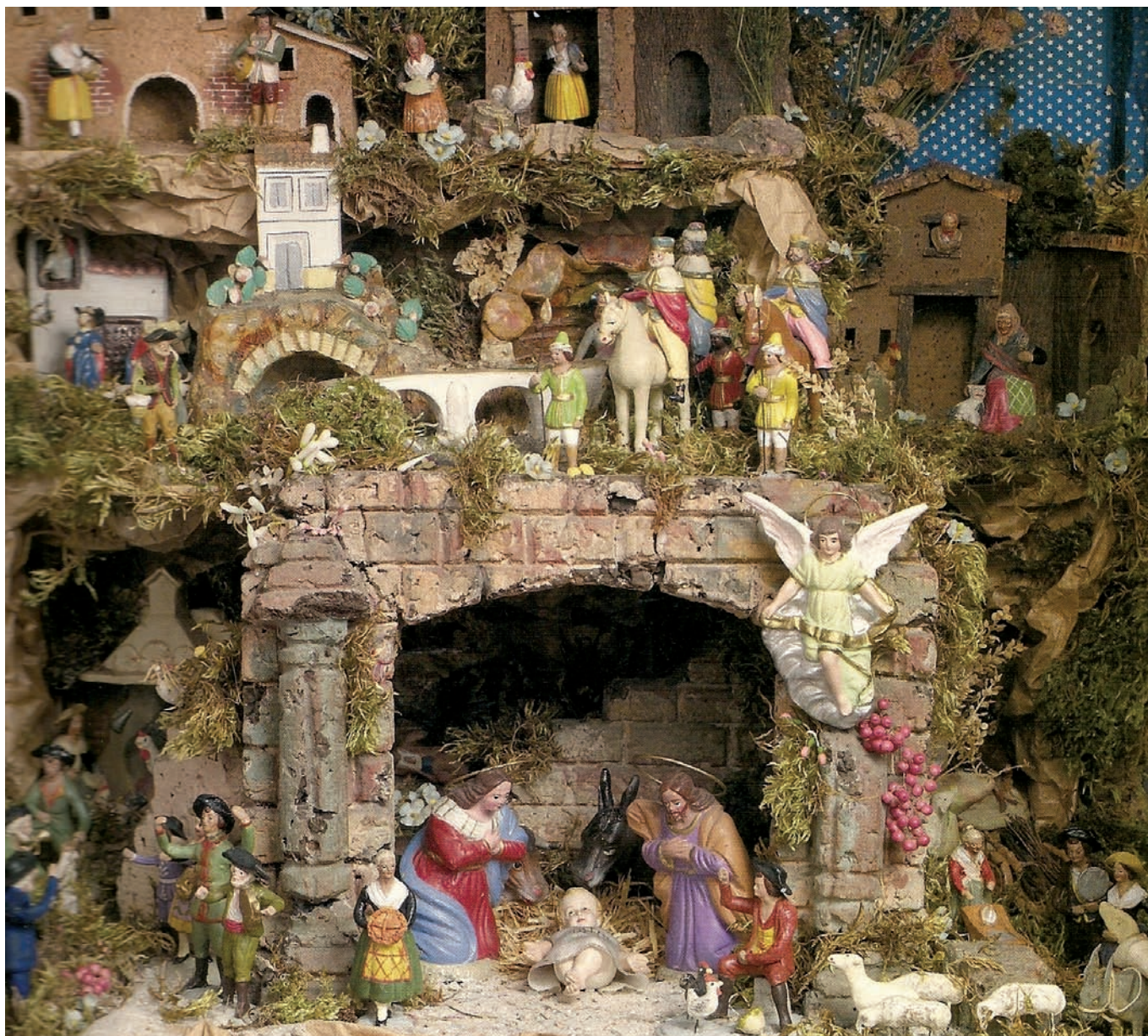
Belén procedente de la Cuenca de Pamplona (siglo XIX).

las figuras de José, María y varios pastores, arrodillados en actitud de adorar al Niño reclinado en el pesebre, acción que un asno y un buey imitaban con la mayor compostura. Esta colección de muñecos llamada nacimiento se sigue exhibiendo todavía en muchas casas, aunque ya no para el público, sino para diversión y satisfacción piadosa de la familia y de los amigos más íntimos. En esta época a que me refiero, los nacimientos eran pretexto para organizar grandes fiestas y pasar varias noches bailando y entreteniéndose... Las habitaciones se iluminaban al atardecer y no sólo los amigos de la familia tenían derecho a dis-