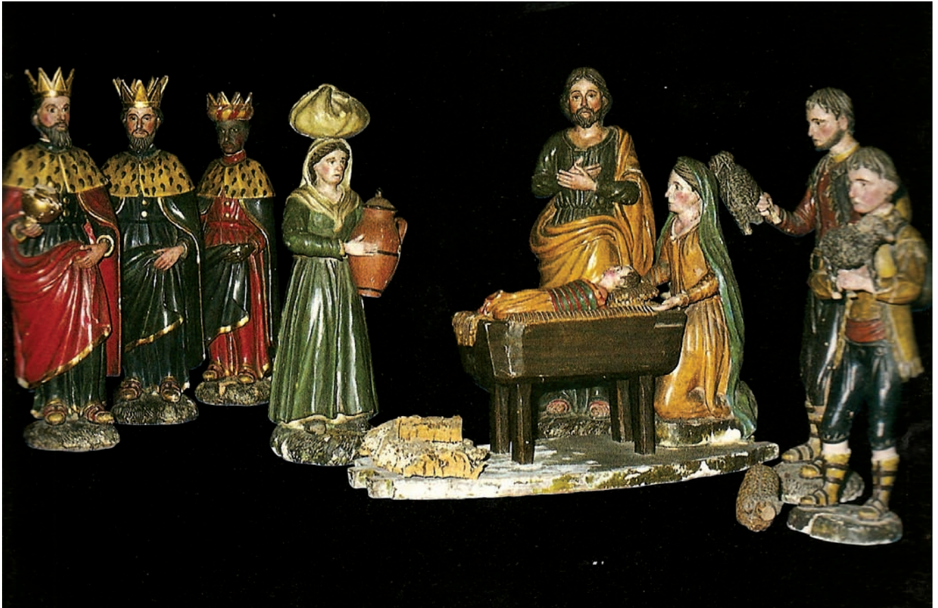
Belén de la parroquia de Mendigorria (1825).

discípulos de Goya; también los hay en el Museo de Navarra..