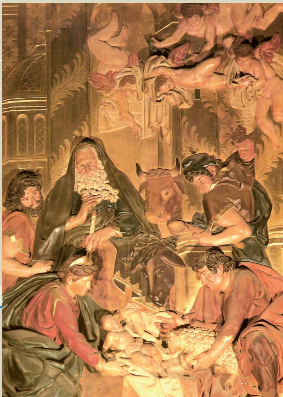
Adoración de los pastores. Retablo de Cáseda, obra de Juan de Anchieta (1581)