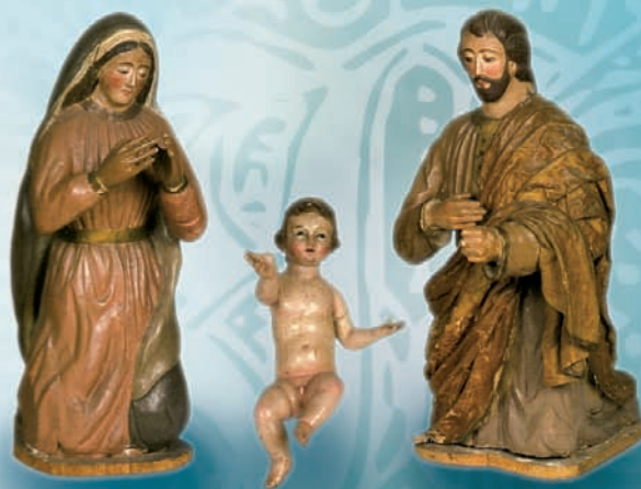
Nacimiento de la parroquia de Santiago de Sangüesa (siglo XVIII)