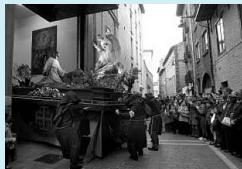
Nueva procesión del Jueves Santo

El Jueves Santo (9 de abril) tuvo especial relieve, pues sirvió para dar mayor vigor a la vida de la Hermandad con una nueva actividad. Tras los oficios en la Catedral tuvo lugar una solemne Procesión y Acto de Oración, en el que participaron los Pasos de la Última Cena, la Oración en el Huerto y el Prendimiento, realizados por tres manípulos, la banda de tambores y un numeroso grupo de hachones. En la plaza de Santa María la Real tuvo lugar el acto de Oración, cuyas lecturas fueron realizadas por el Capellán, mientras que las reflexiones corrieron a cargo del Sr. Arzobispo. Los medios de comunicación señalaron la asistencia de 3.500 personas. El éxito logrado anima a continuar en su celebración.