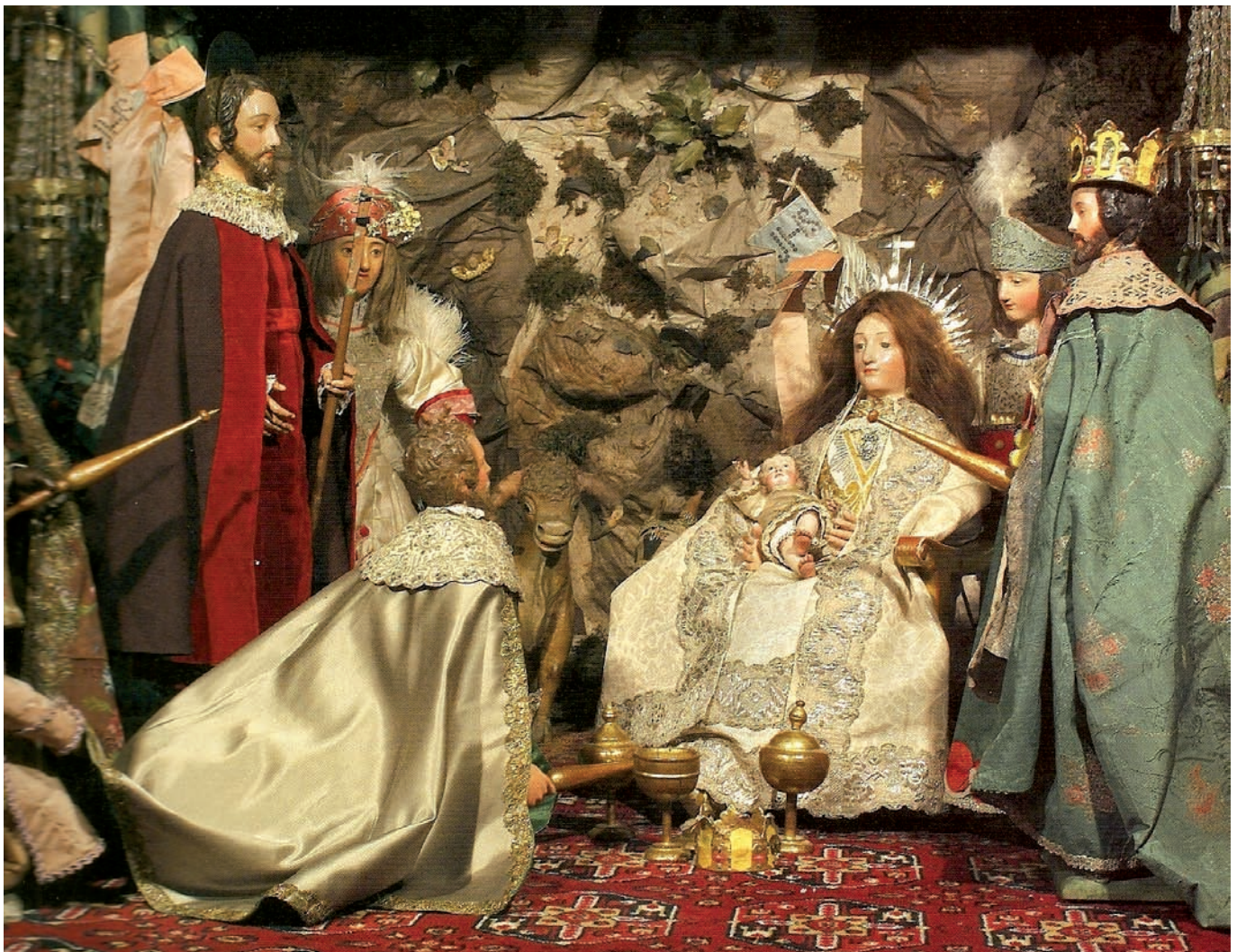
Nacimiento del belén de las Agustinas Recoletas de Pamplona (siglo XVII)

No abundan las noticias sobre el momento en que llegaron a la capital navarra los primeros belenes, o representaciones tridimensionales del nacimiento de Cristo. Sin duda, fue en los conventos de algunas órdenes religiosas en donde se incorporaron aquellos montajes, auténticos microcosmos festivos, tan válidos para el adoctrinamiento y la