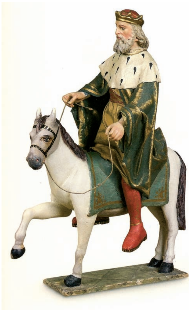
Rey Melchor en el belén de la parroquia de Falces (siglo XIX)

“La cultura cristiana, o al menos una de las culturas cristianas, se ha hecho a través de los Belenes, que han tenido una influencia determinante en ella. Los belenistas cristianos y católicos, y aun los que sin serlo se abren sensibles a los valores humanos de las expresiones religiosas, difunden y promueven los Belenes” (Ángel Suquia, arzobispo de Madrid, en el libro “El mundo de los Belenes”).