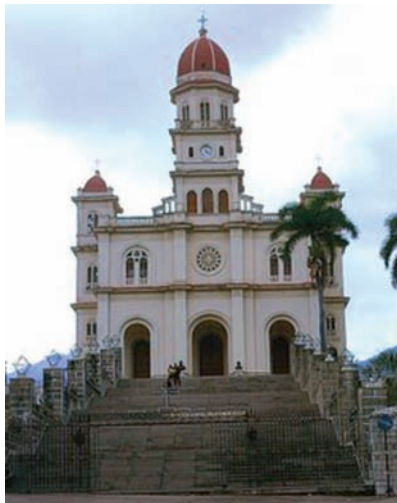
Santuario de la Virgen de la Caridad