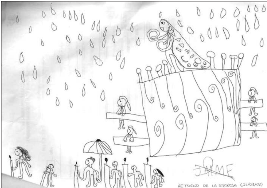
Dibujo "Dolorosa". Jaime Ciriaco

Hace ya un tiempo caía en mis manos este sencillo dibujo que acompaña a mi escrito. Y porque me llamó la atención ahora quiero regalároslo a todos vosotros, los asiduos y puntuales lectores de la revista Mozorro.