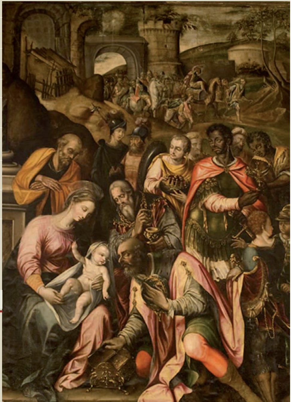
Retablo Monasterio Santa M a La Real de Fitero. Epifanía. Rolan de Moix (1.590)