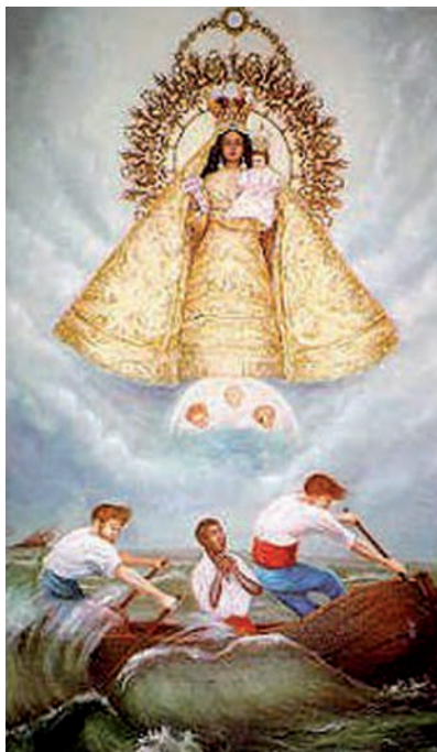
Virgen de la Caridad del Cobre

En el año 2.012 celebraremos en Cuba el cuarto centenario de la aparición de la Virgen de la Caridad, en la bahía de Nipe, en la provincia de Huguín, año 1.612. La encontraron tres jóvenes, uno de ellos todavía niño, que iban en su barquita en busca de sal. En medio de la bahía, flotando sobre una tabla, encontraron la imagen de una Virgen; en la tabla estaba escrito en letras grandes, "Yo soy la Virgen de la Caridad". A pesar del oleaje milagrosamente la imagen estaba seca. Actualmente la Virgen de la Caridad se venera en el Santuario del Cobre, pueblecito próximo a Santiago de Cuba.