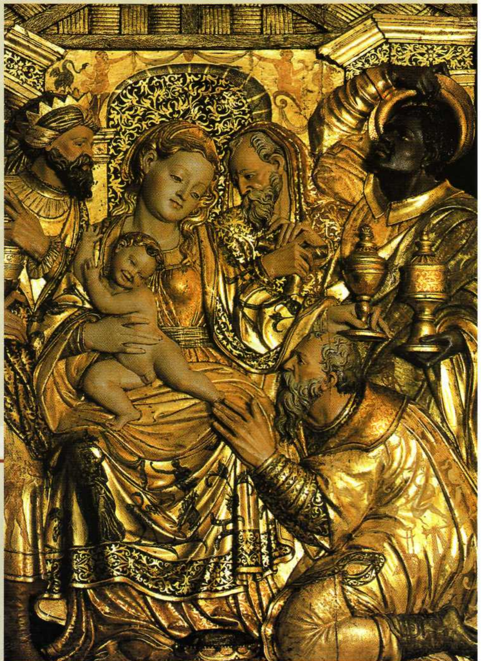
Retablo Parroquia de La Asunción. (Lapoblación) Siglo XVI