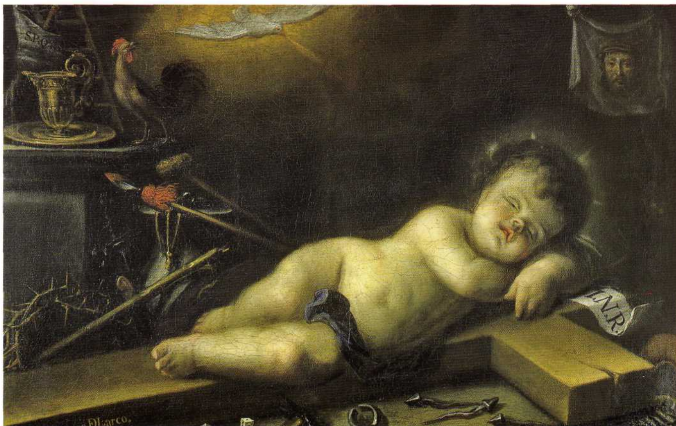
"El Niño Dios dormido sobre la Cruz." Alonso del Arco. 1.681. Museo de la Real Academia de Bellas Artes de San Fernando.