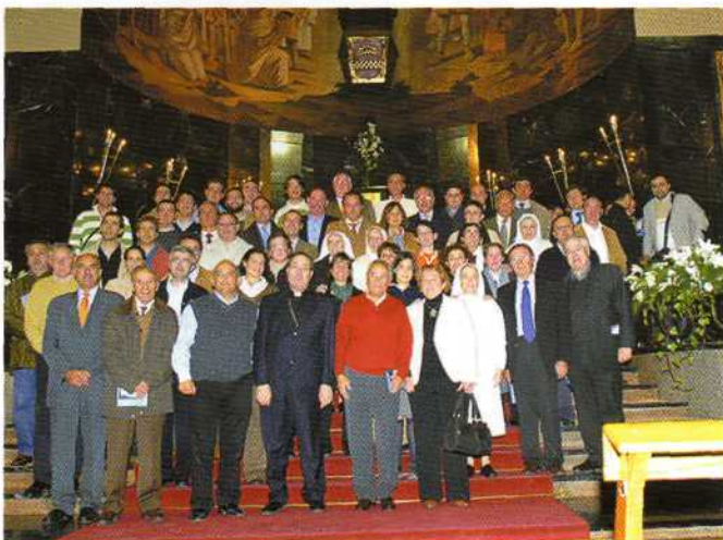
Colaboradores acto de despedida