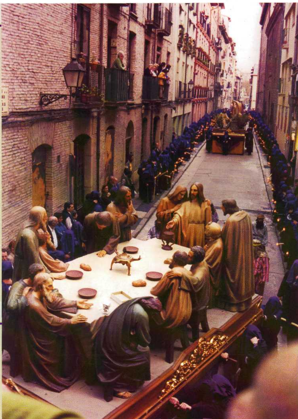
"La última cena" • Premio V concurso fotográfico La Pasión del Señor