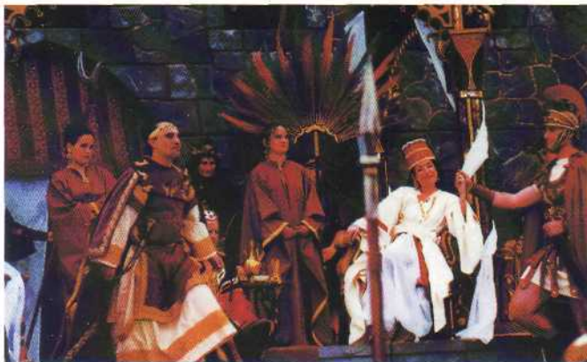
Juicio de Herodes, año 2000