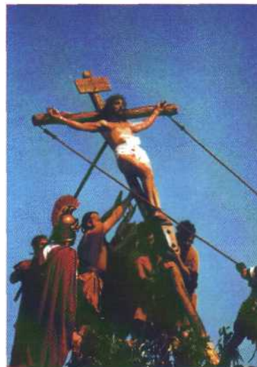
Alzamiento de Jesús en la Cruz, año 2001

La comitiva, ya con el cirineo a cargo de la cruz, enfila la calle San Juan, tan céntrica para Castro como nuestra calle Estafeta, y aquí tiene lugar la tercera y última caída. Al término de la calle tenemos la atalaya que hace de Calvario, donde tiene lugar la representación final.