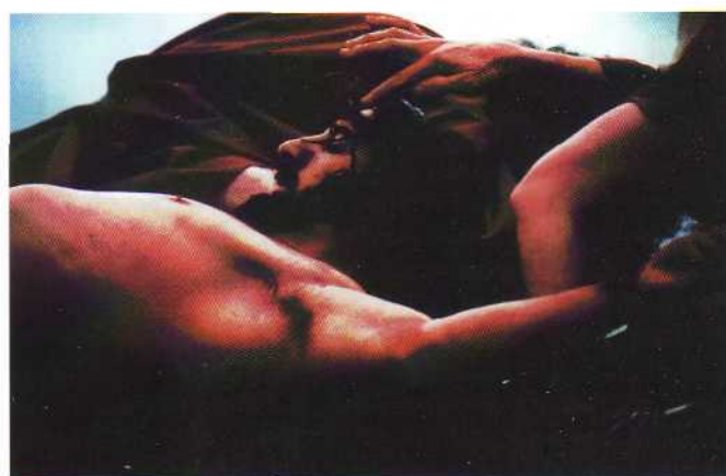
Jesús coronado de espinas, año 1992

Como bien sabemos en la Hermandad, la Pasión dura un día, pero es necesario ensayar para que las cuatro horas largas de representación salgan a la perfección. Por eso, desde enero se juntan por grupos escénicos de lunes a viernes para ensayar sus papeles. Hasta hace poco lo hacían en su pequeña bajera, donde además construían los decorados y guardaban los trajes. Aquello era un caos y resultaba difícil comprender cómo podía salir luego todo tan bien. Ahora hay mayor comodidad, ya que el Ayuntamiento cede un local para construir los monumentales decorados.