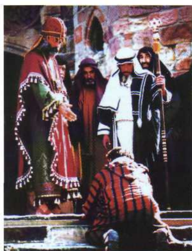
Arrepentimiento de Judas, año 2003

Castro Urdiales es una pequeña población costera de Cantabria de unos 16.000 habitantes, aunque en verano puede acercarse a los cincuenta mil. De orígenes romanos, fundada en tiempos del emperador Vespesiano como Flavióbriga, la vida de la localidad ha girado siempre en torno al mar. En las últimas décadas, la decadencia de la pesca ha reconvertido la población en un destino turístico de los más importantes de la costa cantábrica.