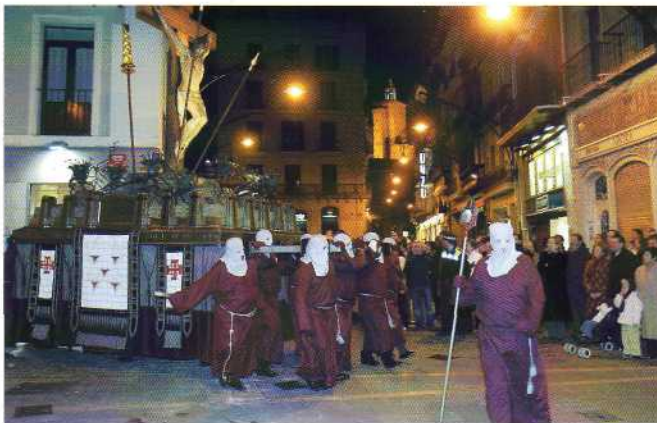
Procesión del Silencio

El pasado Miércoles de Ceniza, 9 de febrero, tuvo lugar la Procesión del Silencio, después de los problemas meteorológicos de los últimos años. La procesión empezó un poco antes de lo habitual, ya que este año se ha recuperado parte del antiguo trazado que recorría esta procesión. Así, en lugar de utilizar la calle Dormitalería o Compañía, la procesión continuó la Bajada de Javier hasta la calle Estafeta, que recorrió para seguir por Mercaderes y Curia. Las obras de la peatonalización del Casco Viejo que rodean estos meses nuestra Hermandad han sido uno de los causantes de ese cambio, aunque también ha tenido peso la opción de llegar a calles más céntricas de la ciudad como es Estafeta, para atraer a mayor número de público, objetivo que se cumplió.